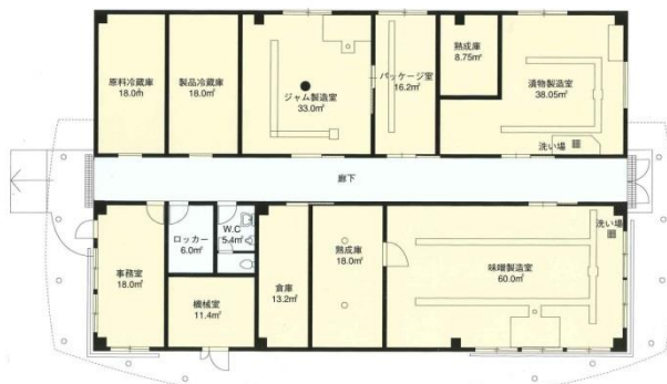
農畜産物処理加工施設平面図